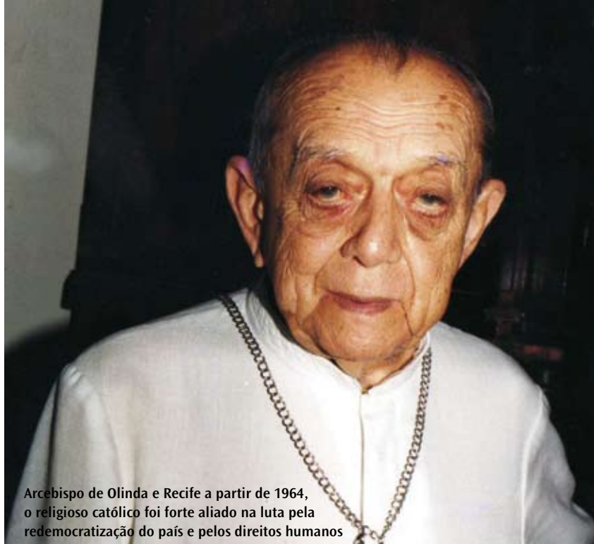
Arcebispo de Olinda e Recife a partir de 1964, o religioso católico foi forte aliado na luta pela redemocratização do país e pelos direitos humanos

No dia seguinte, um grupo de estudantes, no qual eu me incluía, fomos procurar o arcebispo. Queríamos lhe comunicar o ocorrido e pedir apoio para preservar a vida de nosso líder. Dom Hélder, como era de seu perfil, nos ouviu pacientemente, disse que poderíamos contar com sua solidarie-