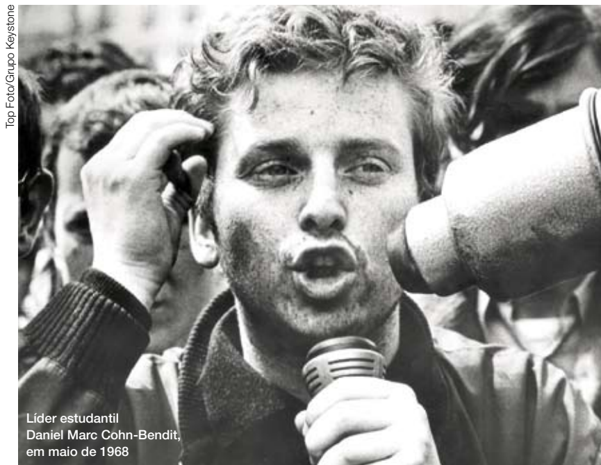
Líder estudantil Daniel Marc Cohn-Bendit, em maio de 1968

Emir Sader é secretário executivo do Conselho Latino-Americano de Ciências Sociais (Clacso)