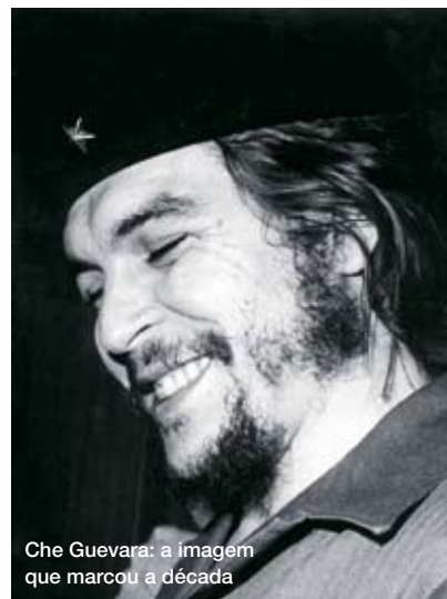
Che Guevara: a imagem que marcou a década

A imagem que marcou a década foi a de Che, especialmente depois da sua morte, em outubro de 1967. Suas citações – além da já mencionada sobre o Vietnã – povoaram as lutas e o imaginário políticos e ideológicos: “O dever de todo revolucionário é fazer a revolução”; “É preciso endurecer, sem perder a ternura, jamais.”; “o verdadeiro revolucionário é feito de grandes sentimentos de amor”.